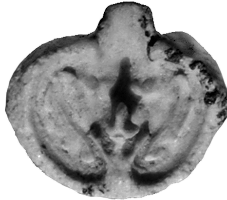
Рис. 1. Спинная створка раковины Lakazella sp. Средний эоцен, г. Ингулец. Увеличено в 10 раз.